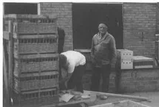
Oud papier en duiven: Elke zaterdag tussen 9.00u en 12.00u wordt er oud papier ingezameld in het "oude" duivenlokaal aan de Papestraat. De opbrengst komt ten goede aan de vereniging De Zwaluw.