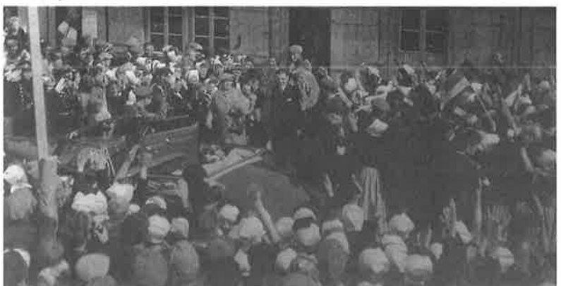
Het gemeentehuis met ontvangst van Koningin Wilhelmina.