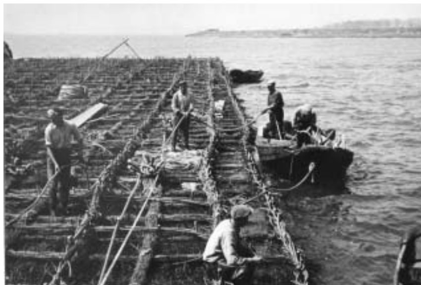
Rijswerkers maken een zinkstuk.

Gereedschappen en werkkleding, aquarellen van de verschillende dijkgaten, een filmpje over de inundatie en de dichting van de dijken maken de expositie compleet. De expositie blijft een jaar staan en gaat daarna voor een nog te bepalen periode naar het nog op te richten ontmoetingscentrum Bevrijding Ramskapelle in België.